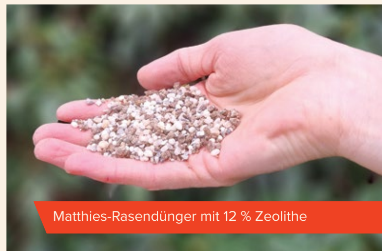
Matthies-Rasendünger mit 12 % Zeolithe