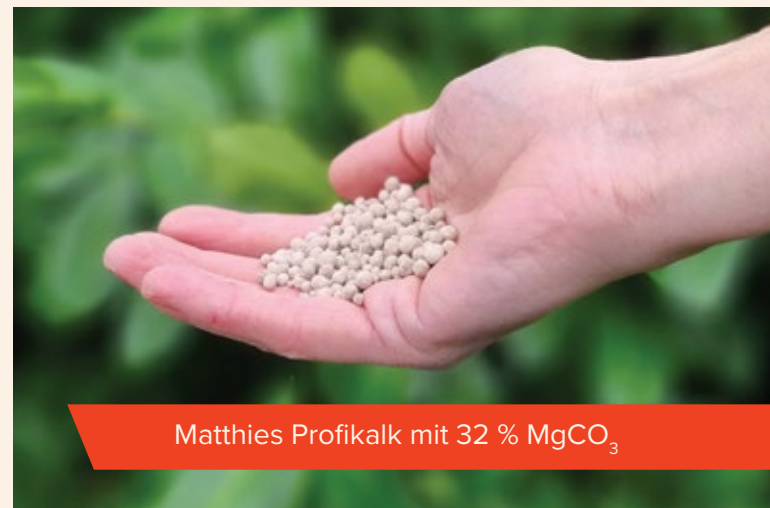
Matthies Profikalk mit 32 % MgCO_3

Unser Produkt vereint die positiven Aspekte und stellt damit eine optimale Mischung dar.